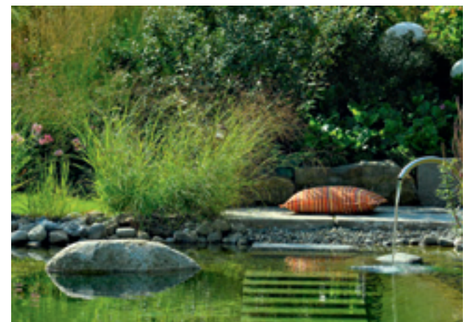
Ein Wasserspiel am Uferand sorgt für akustische Untermalung.

Jeder Schwimmteich ist für uns ein Unikat. Streng formal oder naturnah – die Form orientiert sich am Stil Ihres Gartens. Und unsere langjährige Erfahrung im Schwimmteichbau garantiert Ihnen Kompetenz und Sicherheit. In unserer Mustergartenanlage präsentieren wir Ihnen die vielfältigen Möglichkeiten des Schwimmteichs. Besuchen Sie uns und lassen Sie sich von unserem großen Schwimmteich in unserer Mustergartenanlage inspirieren. Unser Schaugarten ist von Montag bis Freitag von 10 bis 18 Uhr und am Samstag jeweils von 10 bis 14 Uhr für Sie geöffnet. Wir freuen uns auf Ihren Besuch! Gerne können Sie auch unter der Telefonnummer 07161-965900-0 einen individuellen Beratungstermin mit uns vereinbaren! //