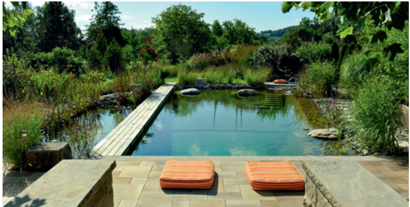
Von der sonnigen Terrasse unseres Schaugartens geht der Blick über den großzügigen Schwimmteich.